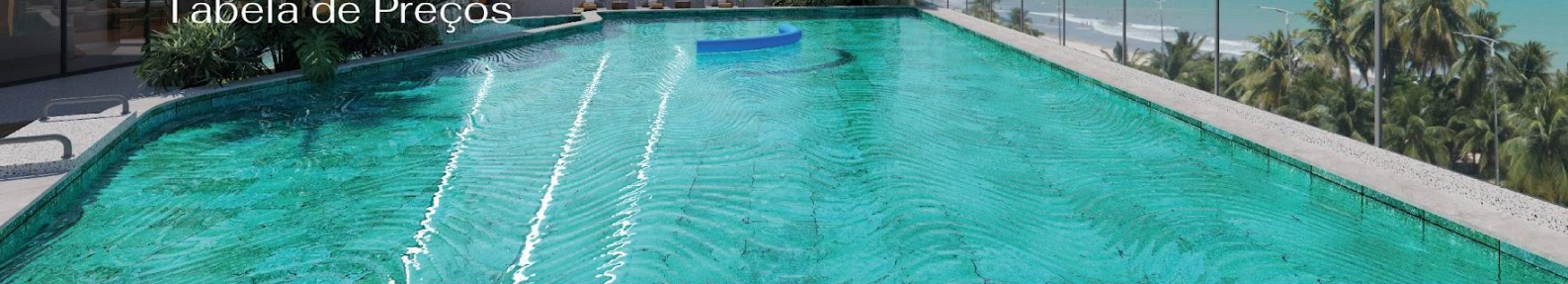
Tabela de Preços